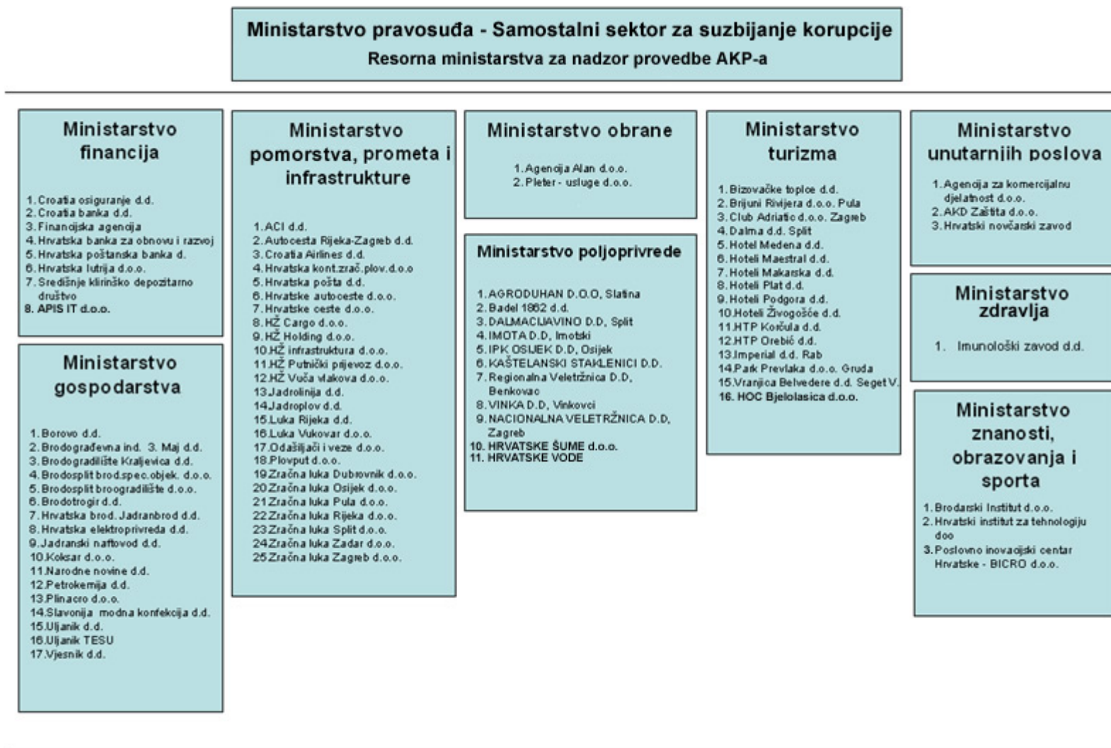
Slika 2. Struktura i koordinacija AKP izvještaja prema resornim ministarstvima i trgovačkim društvima